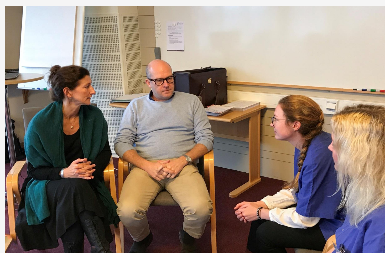
En viktig och uppskattad del av EDHEP är att öva samtalsfärdigheter i rollspel med fingerade närstående.