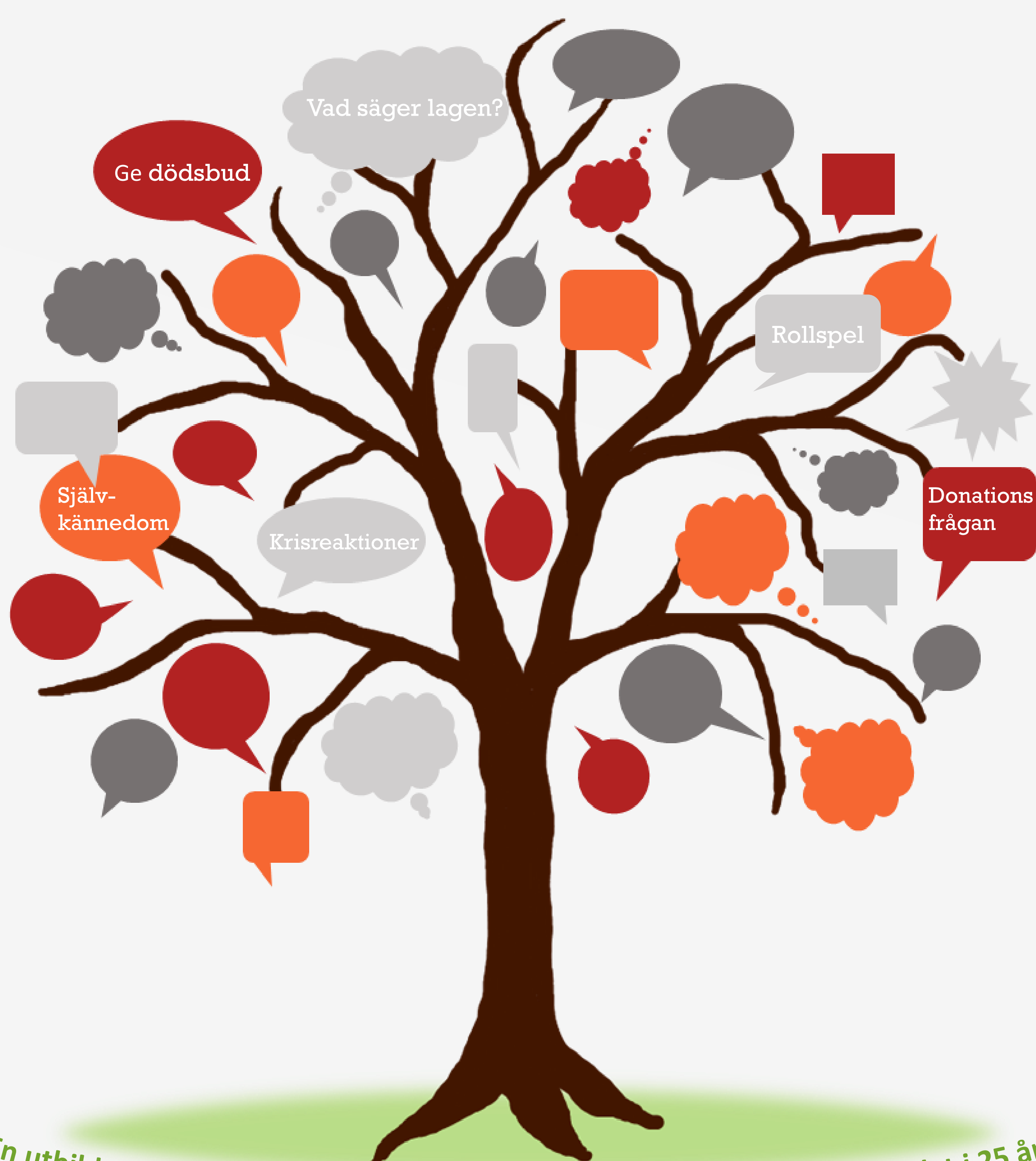
En utbildning som bedrivits och följt utvecklingen inom donationsområdet i 25 år!

Jag var så himla orolig för rollspelen, men åh så lärorikt det var... och så verkligt!